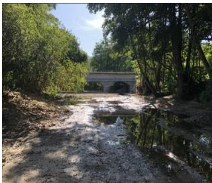
Août et décembre 2019