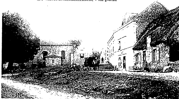
LA CREUSE PITTORESQUE 1303 SAINT-SILVAIN-BELLEGARDE - Vue générale

D'après les recensements de la population de la commune de St Silvain pour les années ci-après les chiffres sont les suivants : 1801 (1671hab), 1846 (1308hab), 1872 (961hab), 1896 (813hab), 1901 (840hab) 1911 (716hab), 1921 (625hab), 1946 (504hab), 1982 (248hab) 1990 (238hab)